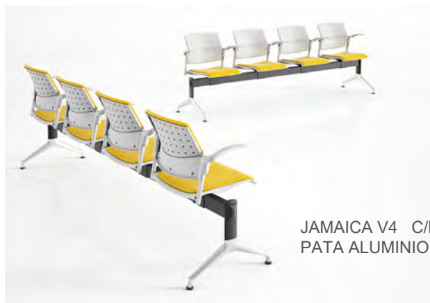
JAMAICA V4 C/BRAZOS PATA ALUMINIO PULIDO