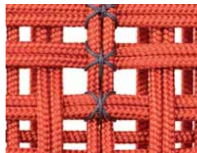
detalle en contraste, en color antracita brillante